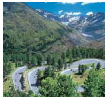
1 Gletscherstraße ins ewige Eis Die Kaunertaler Gletscher bringt Sie auf einer Länge von 26 Kilometern und 29 Kehren direkt an den Rand des „ewigen Eises“ auf 2750 m.