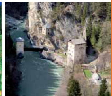
8 Kulturdenkmal Altfinsternmünz Altfinsternmünz zählt zu den malerischsten und kraftvollsten Plätzen Tirols. Hier wird die Geschichte hautnah erlebbar.