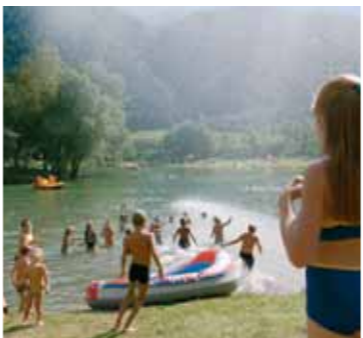
4 Badesee mit Attraktionen Der Badesee zählt zu den beliebtesten Ausflugszielen. Er lockt mit zahlreichen Möglichkeiten wie der Breitwellen-Wasserrutsche.