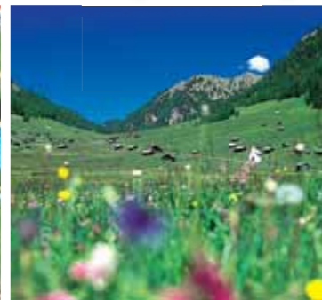
7 Wanderparadies Pfunz Das Hochtal der Pfunz Tschey und das Schluchtenerlebnis in der Radurschlamm sind einige der schönsten regionalen Wanderziele.