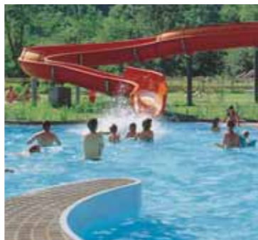
3 Erlebnisfreibad Prutz-Ried 15.000 m 2 Liegefläche mit schattenspendenden Bäumen und die 42 Meter lange Wasserrutsche sind Sommer-Highlights.