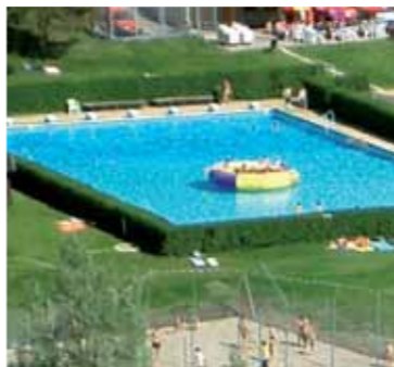
6 Erlebnisfreibad Pfunz Mit 750 m 2 großer Wasserfläche, eigenem Kinderplanschbecken, Spielplatz, Liegewiese, Beachvolleyballplatz ... einfach erfrischend!