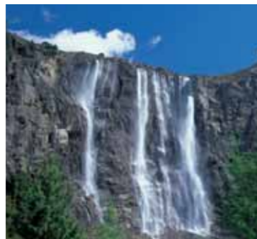
2 Fallender Bach mit Klettersteig Der „Fallende Bach“ ist ein Naturwahrzeichen. Mehr als 150 Meter stürzt das Wasser hier in die Tiefe. Ein Klettersteig führt daneben vorbei.