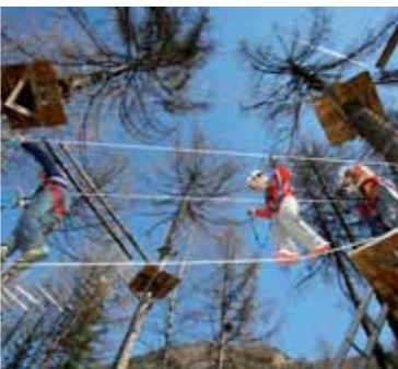
5 Outdoor Sports Die Hochseilgärten in Ried-Prutz und Pfunz, das Raftingparadies am Inn, Canyoning ... das Tiroler Oberland ist ein Hit des Outdoor Sports.