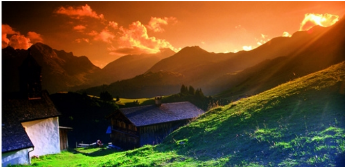
Abendstimmung von Bürstegg Richtung Lech

1940 m , Gesamtlänge 15 km, 4-5 Stunden Gehzeit 600 Höhenmeter im Auf- und Abstieg, Höchster Punkt Wannenkopf 1940 m, leichte Wanderung für die ganze Familie Ausgangspunkt Hotel Adler, Passhöhe Hochtannberg 1675 m