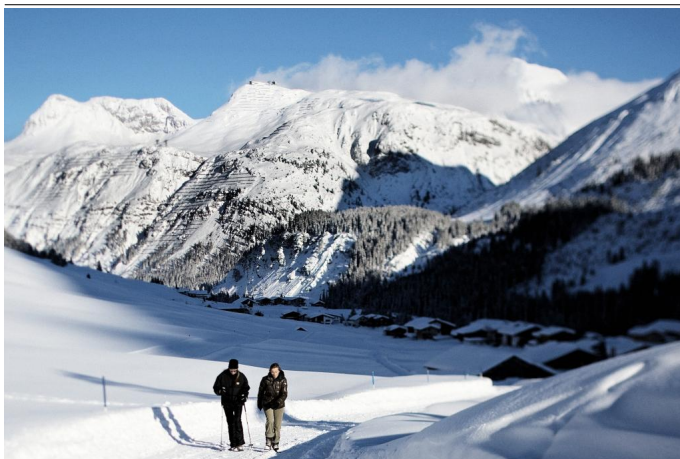
Winterwanderweg Zug Autor Markus Gmeiner Quelle Lech Zürs Tourismus, Markus Gmeiner