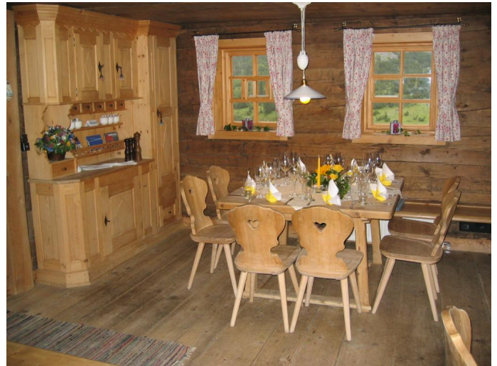
Gasthof Äpele Quelle (c) Lech Zürs Tourismus